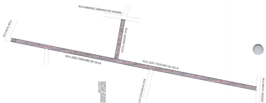
MAPA DE LOCALIZAÇÃO DA MUNICIPALIDADE - RUA JOÃO TEODORO DA SILVA E RUA LINDORO ALVES