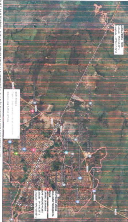
DETALHE DA PROPOSTA - TIPA AO CENTRO DE MASSA DA MUNICIPALIDADE - RUA JOÃO TEODORO DA SILVA E RUA LINDORO ALVES