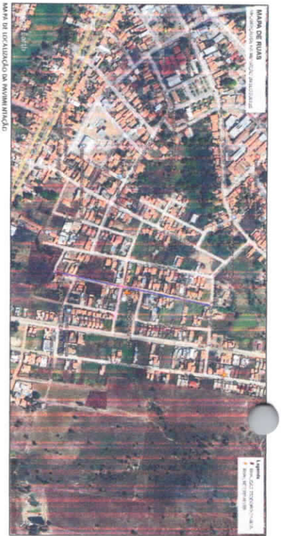
MAPA DE LOCALIZAÇÃO DA MUNICIPALIDADE