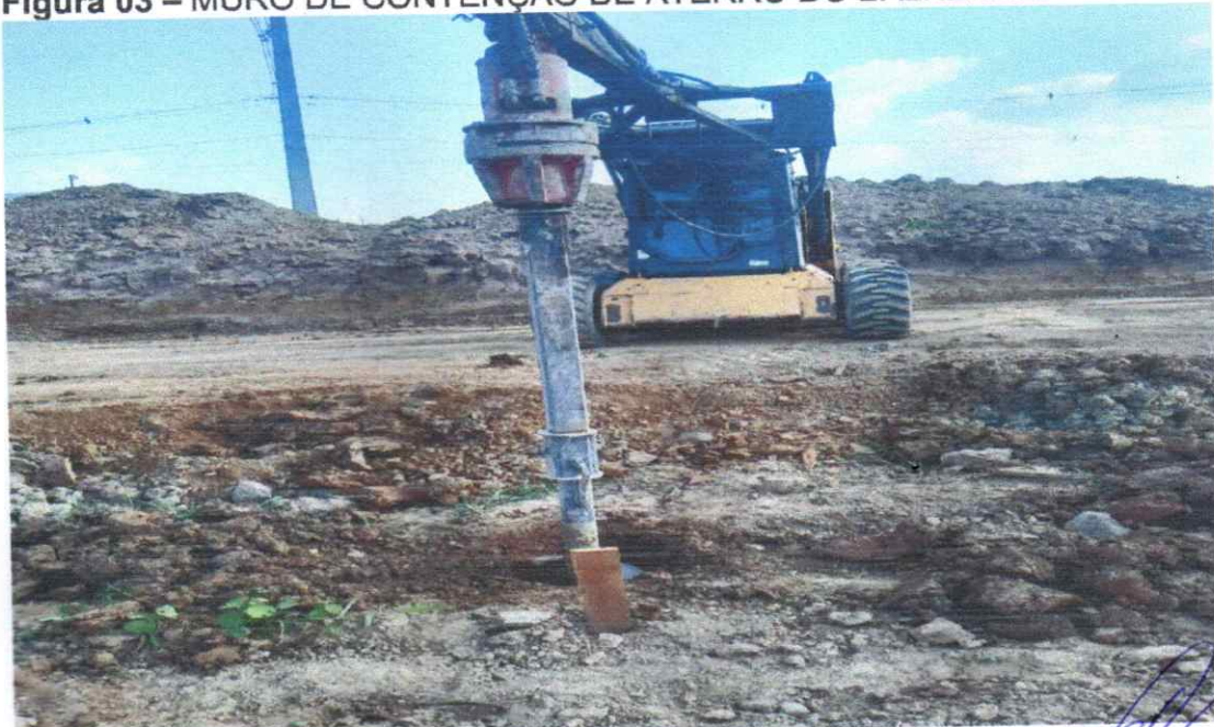
Escavação de estacas de muro de contenção

Enio Rocha Santos Engenheiro Civil CREA/TO 317795/D-TO