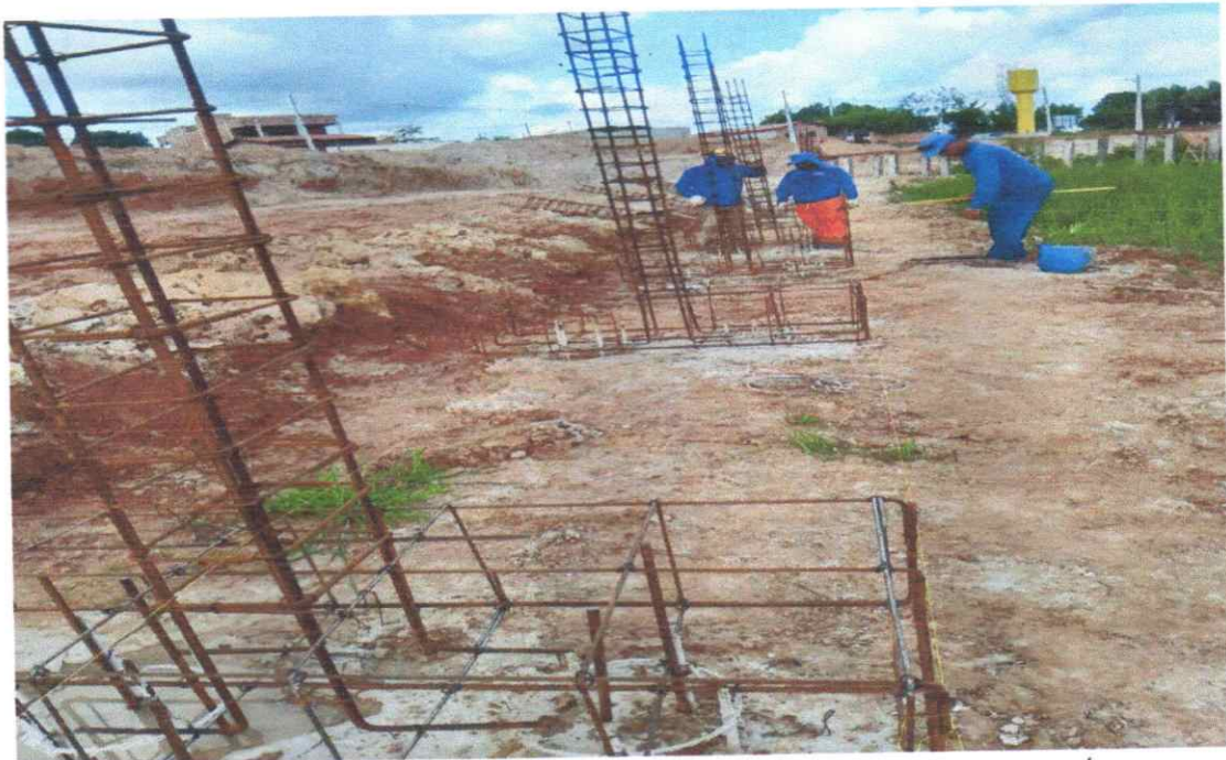
Bloco de coroamento pronto para concretagem sobre estacas escavadas.