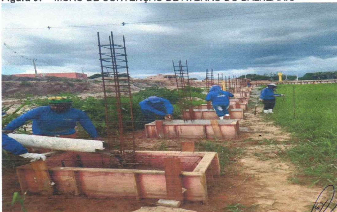
Concretagem de bloco de coroamentos