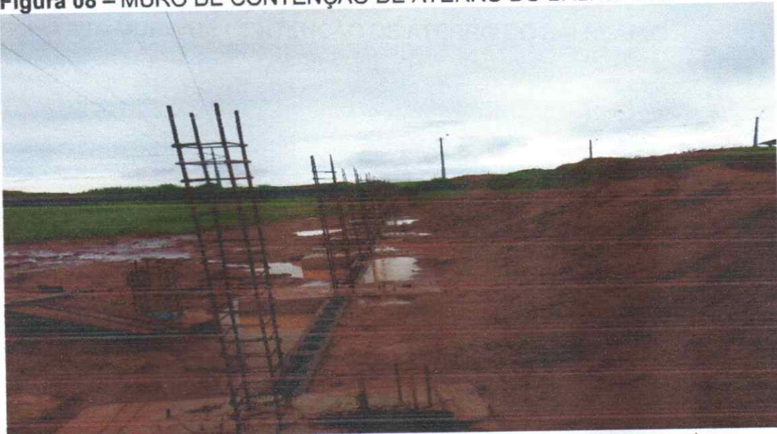
Figura 08 – MURO DE CONTENÇÃO DE ATERRO DO BALNEÁRIO

Estacas escavadas e bloco de coroamento concretados, trecho pronto para viga baldrame.