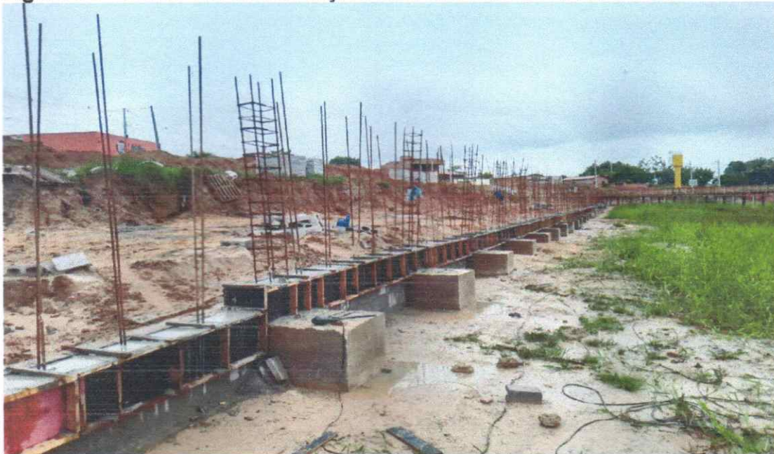
Blocos de coroamento e viga baldrame concretadas