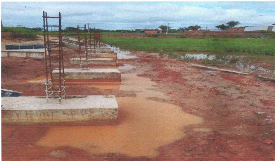
Estacas escavadas e bloco de coroamento concretados