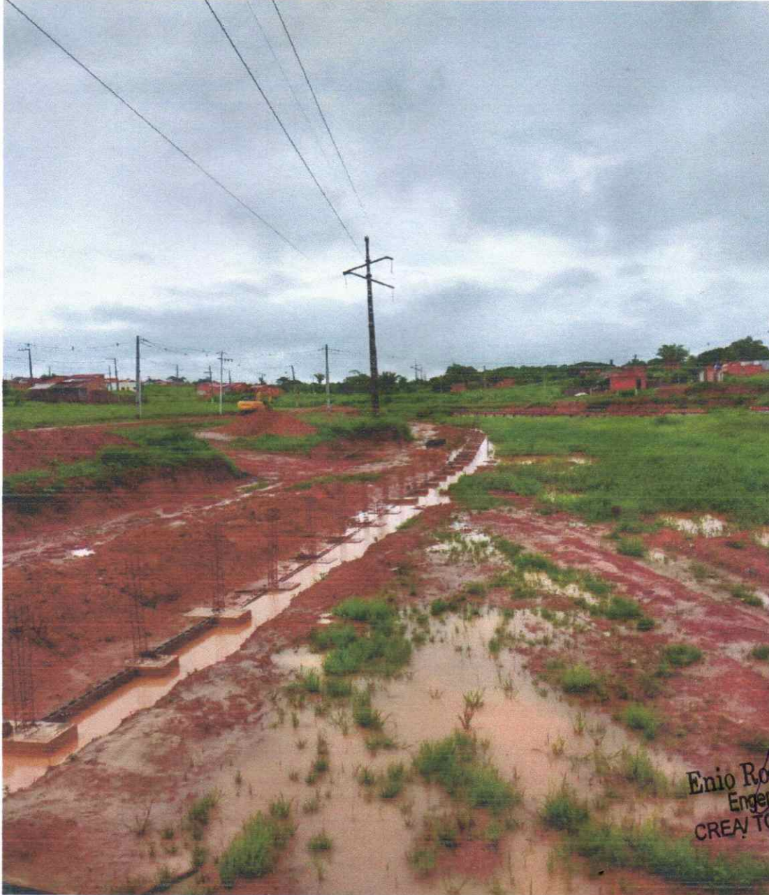
Figura 10 – MURO DE CONTENÇÃO DE ATERRO DO BALNEÁRIO

ESTADO DO TOCANTINS PREFEITURA MUNICIPAL DE AUGUSTINÓPOLIS Rua Dom Pedro I, nº 352, Centro – Augustinópolis -TO