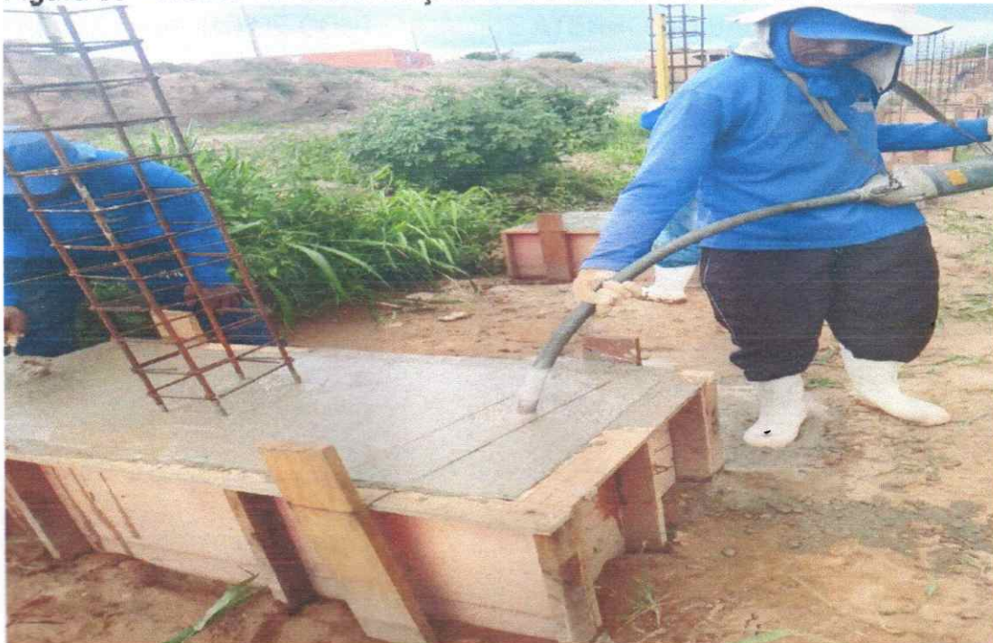
Vibração de concreto de bloco de coroamento para melhor resistência final