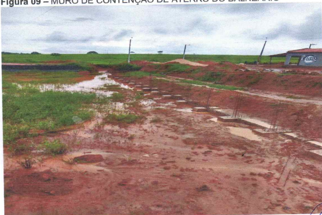
Figura 09 – MURO DE CONTENÇÃO DE ATERRO DO BALNEÁRIO

Estacas escavadas e bloco de coroamento concretados, trecho pronto para viga baldrame