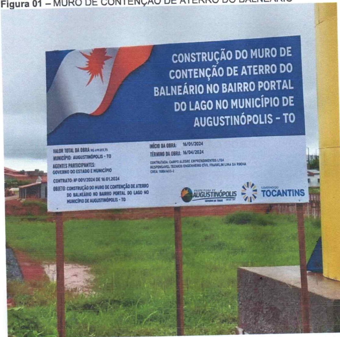
Figura 01 – MURO DE CONTENÇÃO DE ATERRO DO BALNEÁRIO

Placa de obra em chapa de aço galvanizado executado.