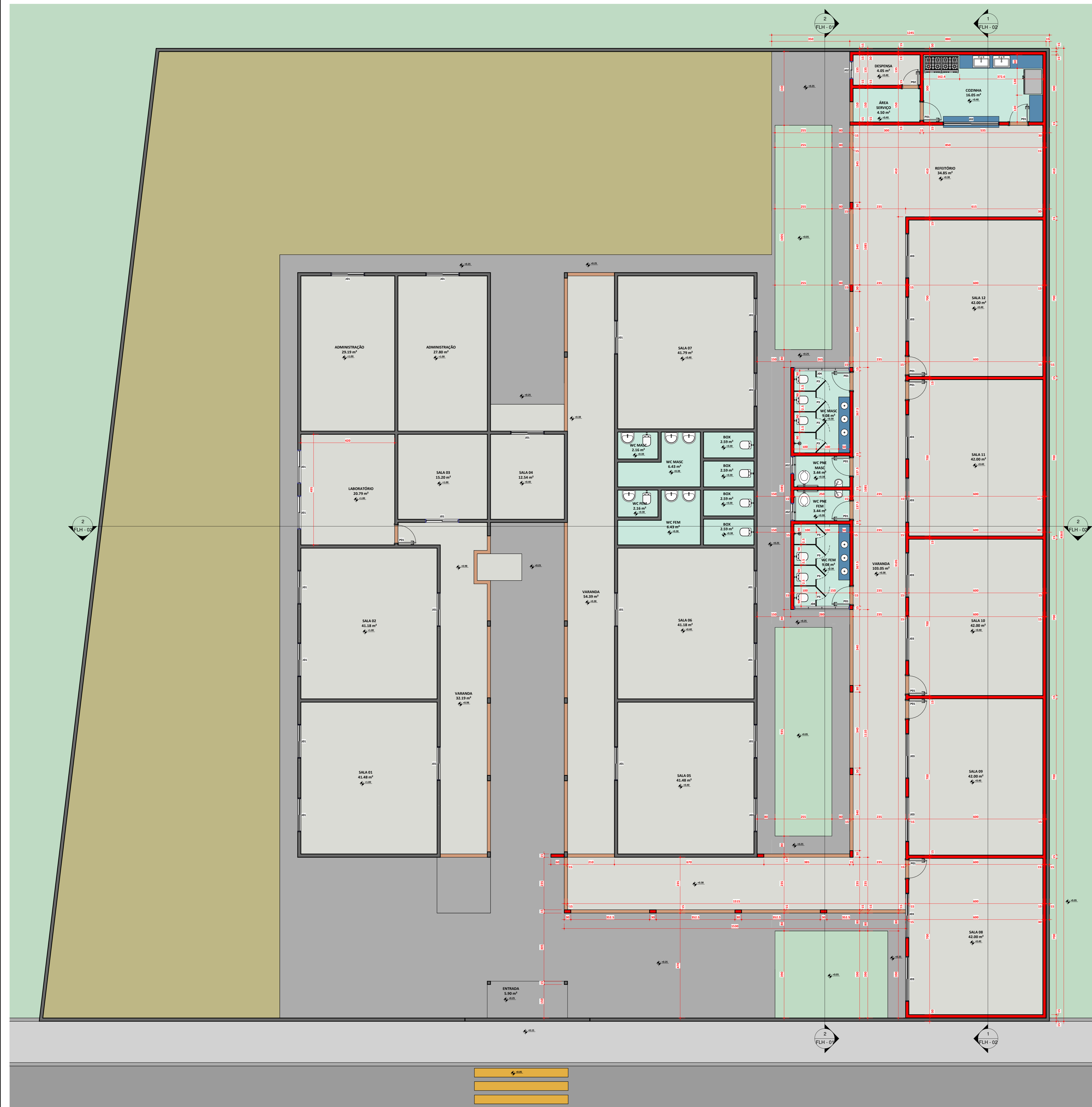
1 PLANTA BAIXA COTAS/EXECUTIVO ESCALA 1:75