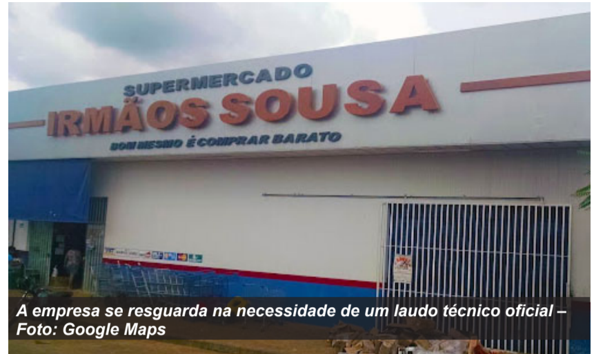
A empresa se resguarda na necessidade de um laudo técnico oficial – Foto: Google Maps

Após repercussão de imagens nas redes sociais, órgão realizou inspeção extraordinária. Embora não tenham sido encontradas moscas ou larvas no momento da ação, fiscais identificaram falhas estruturais e no controle de pragas.