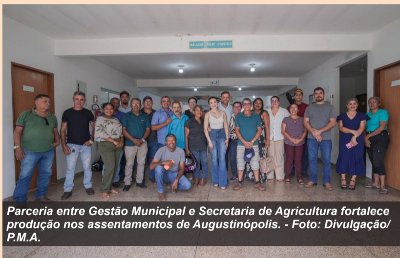
Parceria entre Gestão Municipal e Secretaria de Agricultura fortalece produção nos assentamentos de Augustinópolis.

Durante a reunião, foram discutidos temas essenciais como apoio à agricultura familiar, melhorias no acesso a políticas públicas, fortalecimento da produção rural, infraestrutura, assistência técnica e estratégias para impulsionar a economia local. A iniciativa reafirma o compromisso da gestão municipal com quem vive e produz no campo, valorizando o trabalho dos assentados e buscando soluções conjuntas para os