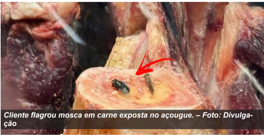
Cliente flagrou mosca em carne exposta no açougue.

Uma denúncia detalhada sobre as condições de higiene no setor de carnes de um supermercado em Augustinópolis movimentou as redes sociais e acendeu um alerta para a saúde pública neste fim de semana. A denúncia, enviada inicialmente à página Augustinópolis City, partiu de uma cliente que utilizou o recurso de geolocalização do seu dispositivo para comprovar que os registros foram feitos exatamente no interior do estabelecimento localizado na Rua Graça Aranha, nº 509, próximo à feira coberta.