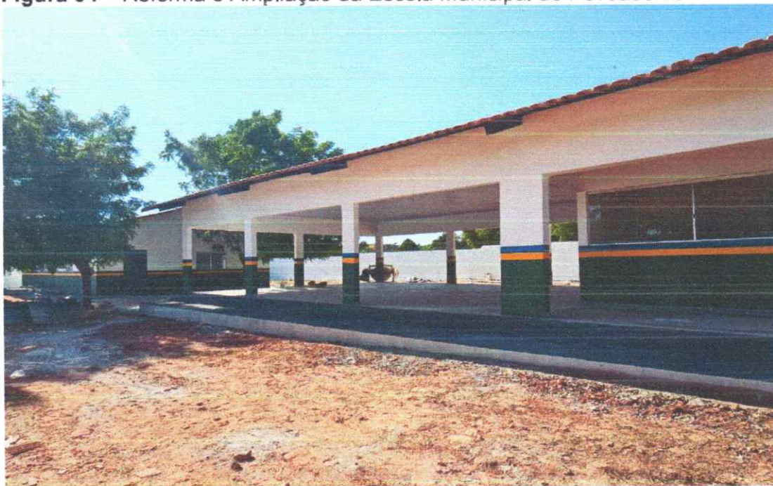
CALÇADA EM CONCRETO EXECUTADA LATERAL ESCOLA