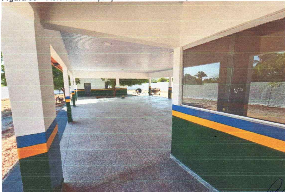
ÁREA INTERNA COM ACABAMENTOS FINALIZADOS