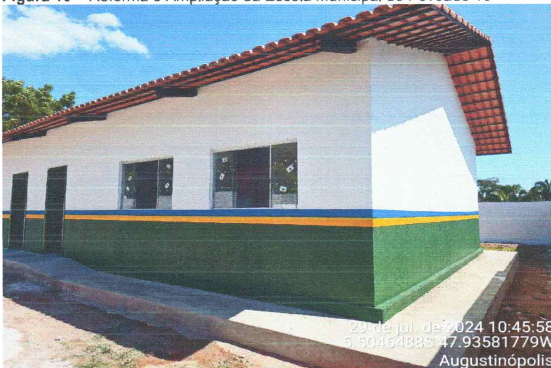
Figura 10 – Reforma e Ampliação da Escola Municipal do Povoado 16

ÁREA EXTERNA COM TEXTURA E PINTURA FINALIZADOS