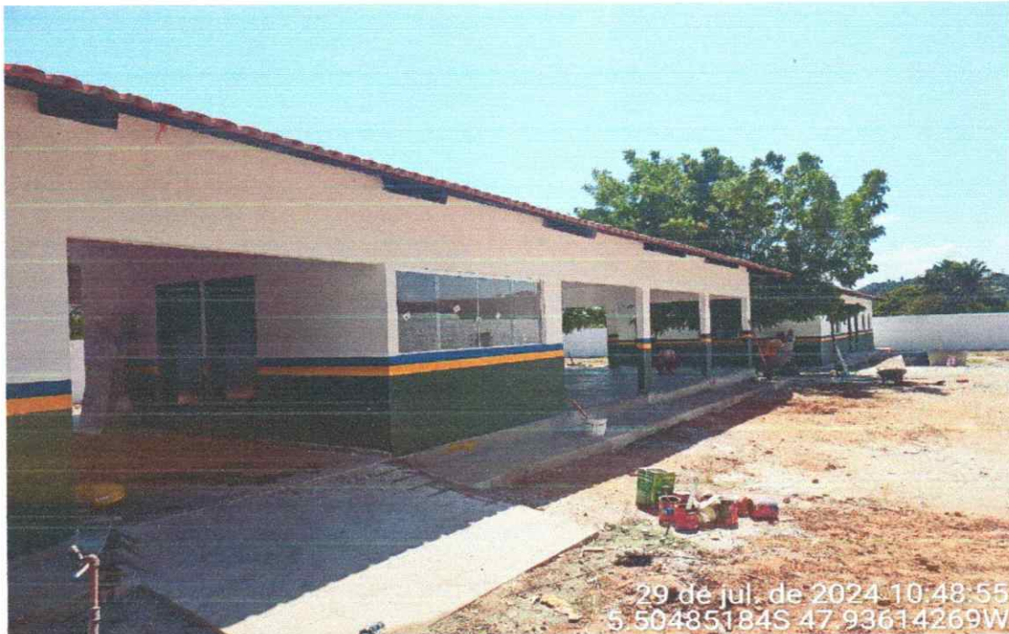
CALÇADA EM CONCRETO EXECUTADA LATERAL ESCOLA