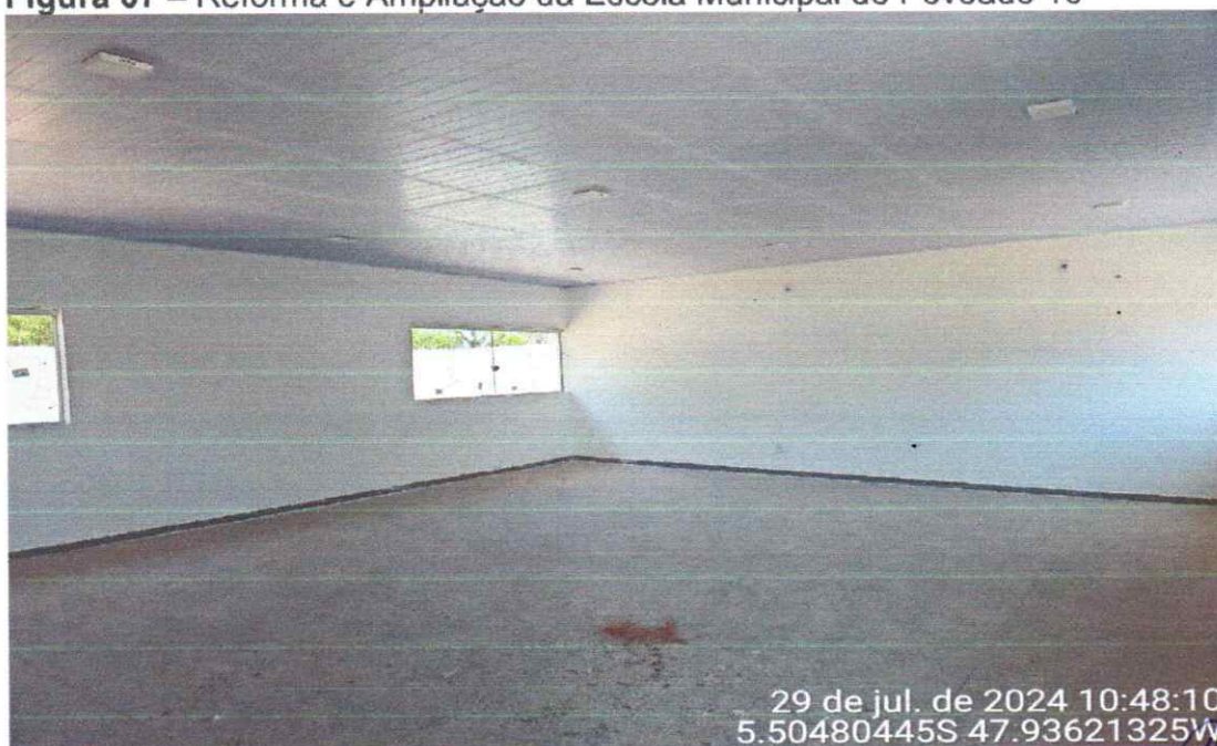
SALA DE AULA COM FORRO PVC E DE ACABAMENTOS CONCLUÍDOS

Enio Rocha Santos Engenheiro Civil CREA/TO 317795/D-TO