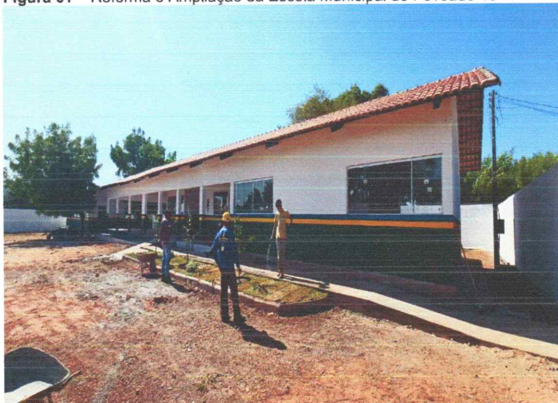
Figura 01 – Reforma e Ampliação da Escola Municipal do Povoado 16

ÁREA EXTERNA COM TEXTURA E PINTURA FINALIZADOS