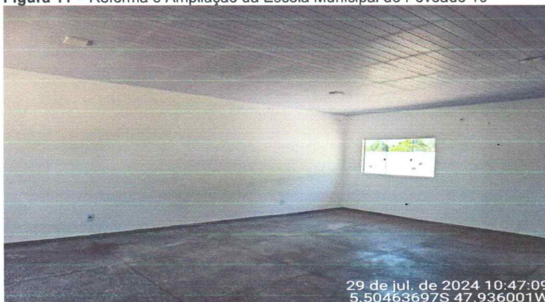
Figura 11 – Reforma e Ampliação da Escola Municipal do Povoado 16

SALA DE AULA COM FORRO PVC E DE ACABAMENTOS CONCLUÍDOS