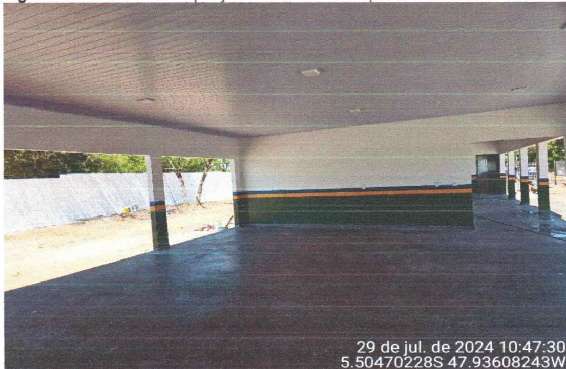
Figura 08 – Reforma e Ampliação da Escola Municipal do Povoado 16

29 de jul. de 2024 10:47:30 5.50470228S 47.93608243W