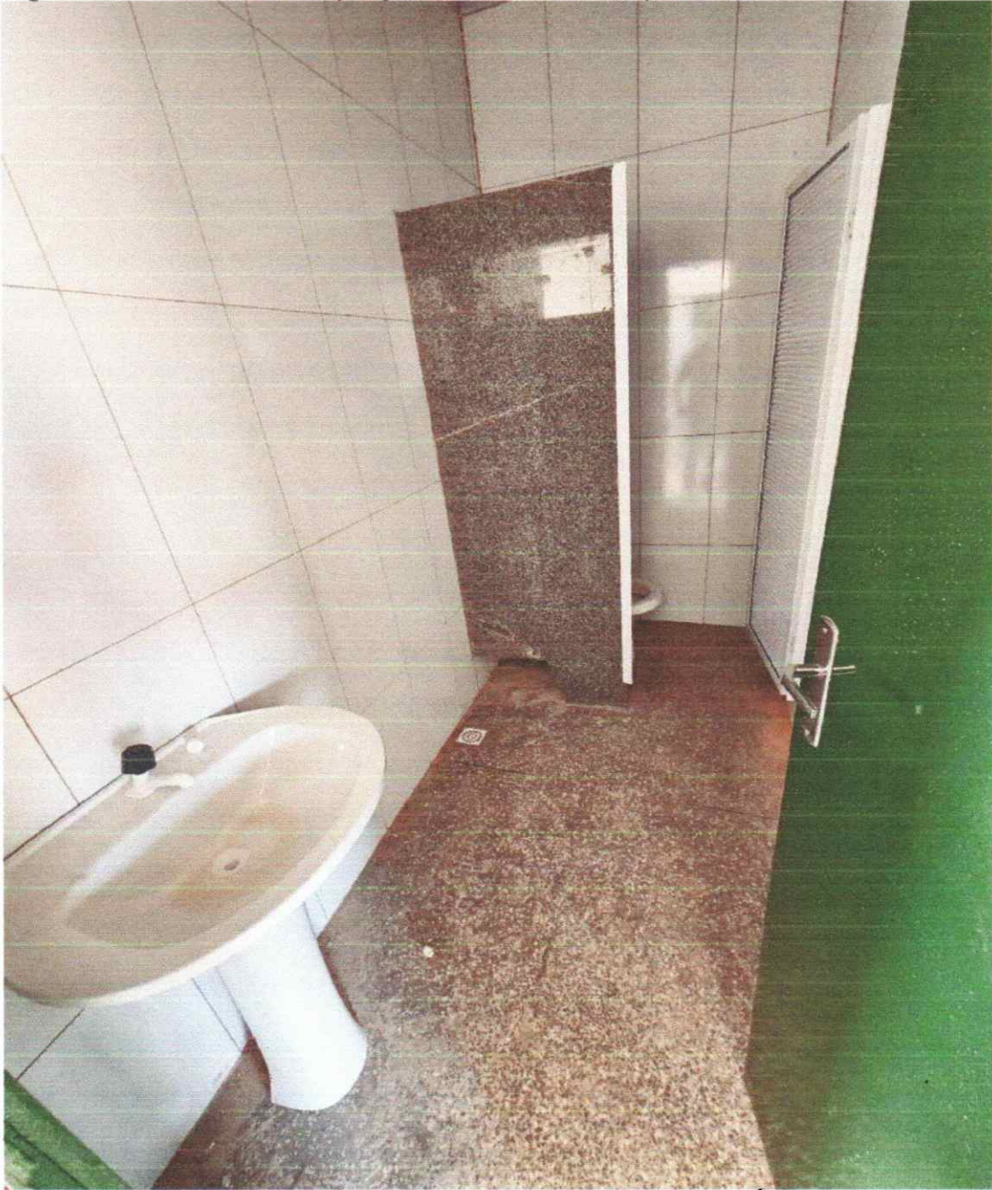
Figura 12 – Reforma e Ampliação da Escola Municipal do Povoado 16

ESTADO DO TOCANTINS PREFEITURA MUNICIPAL DE AUGUSTINÓPOLIS Rua Dom Pedro I, nº 352, Centro – Augustinópolis -TO