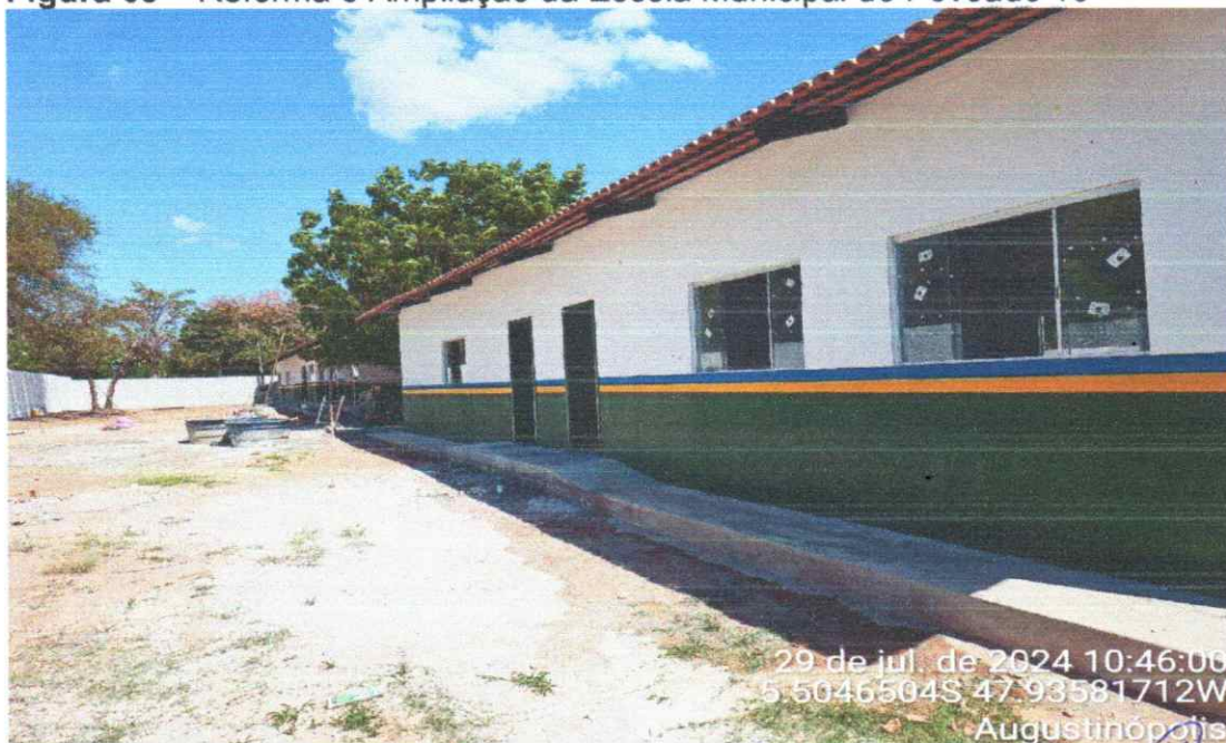
Figura 09 – Reforma e Ampliação da Escola Municipal do Povoado 16

29 de jul. de 2024 10:46:00 5.5046504S 47.93581712W Augustinópolis