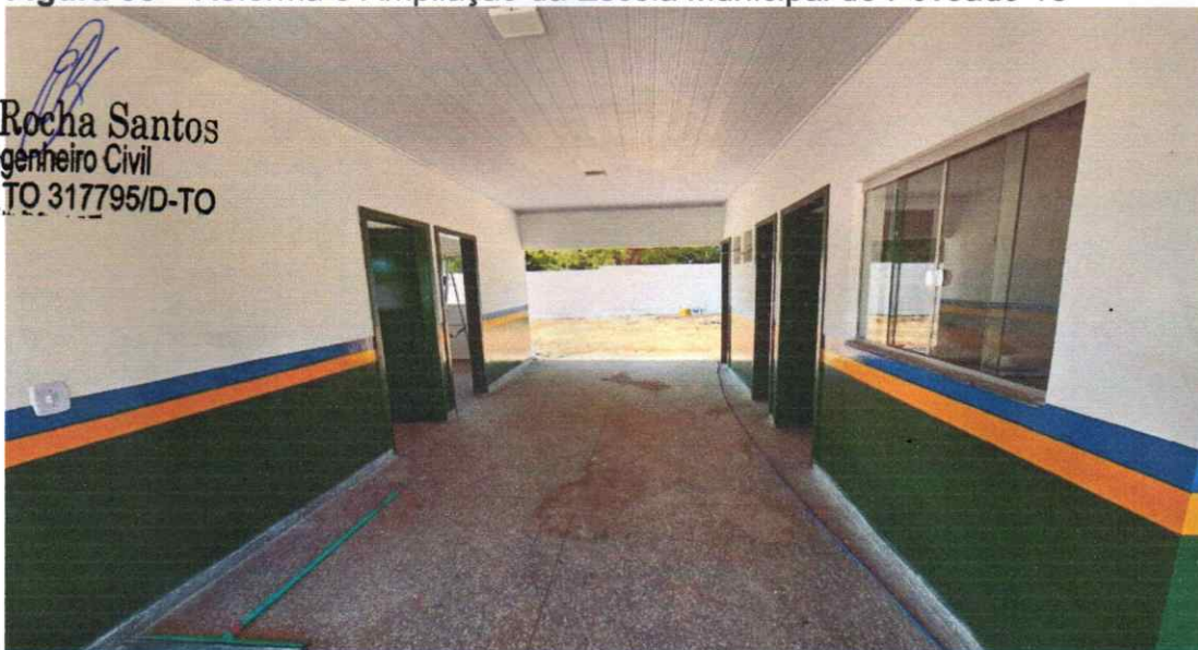
ÁREA INTERNA COM ACABAMENTOS FINALIZADOS