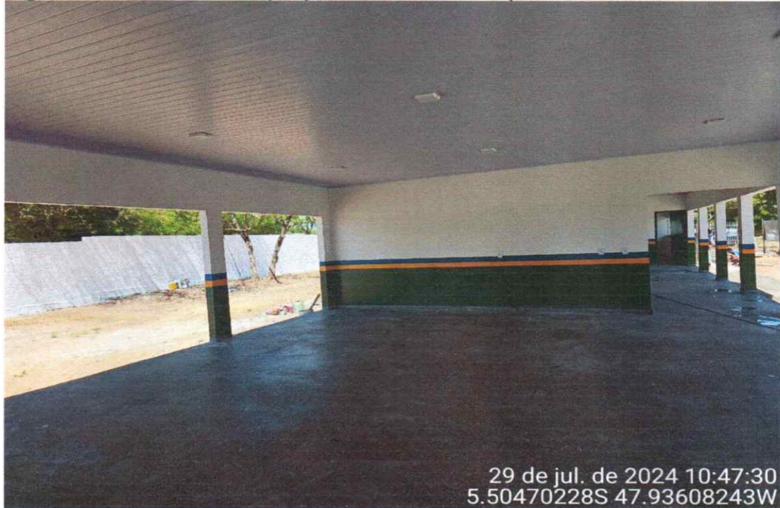
Figura 08 – Reforma e Ampliação da Escola Municipal do Povoado 16

29 de jul. de 2024 10:47:30 5.50470228S 47.93608243W