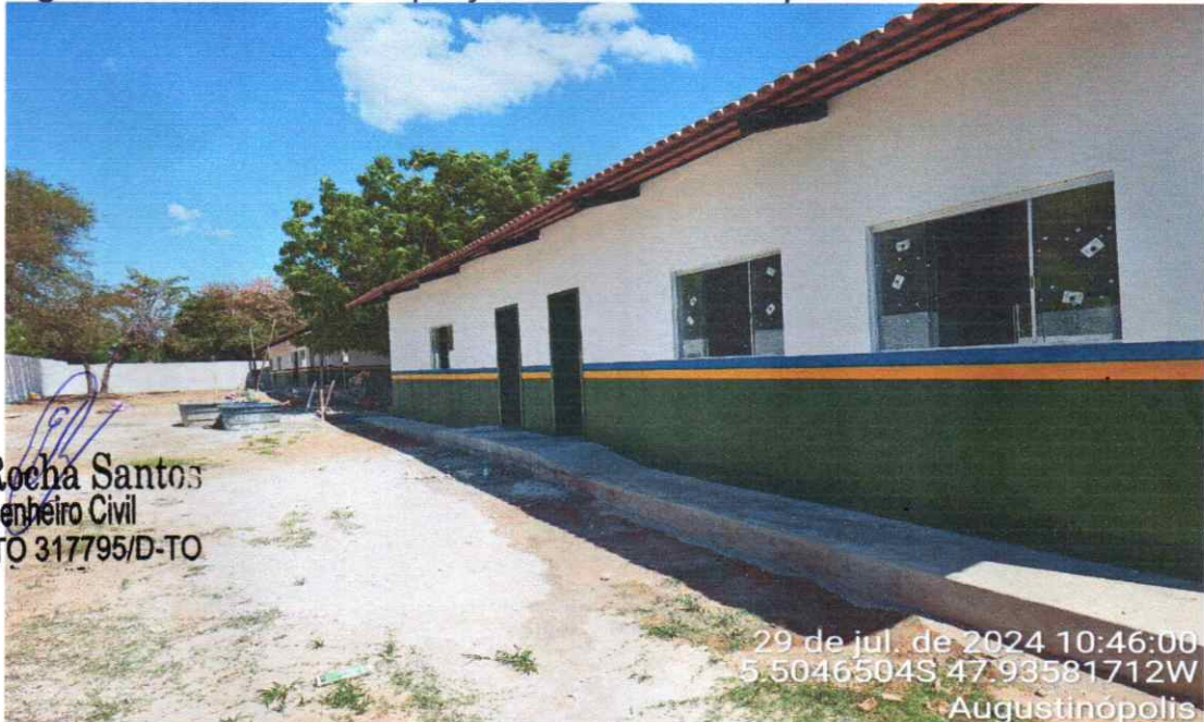
Figura 09 – Reforma e Ampliação da Escola Municipal do Povoado 16

Enio Rocha Santos Engenheiro Civil CREA/TO 317795/D-TO