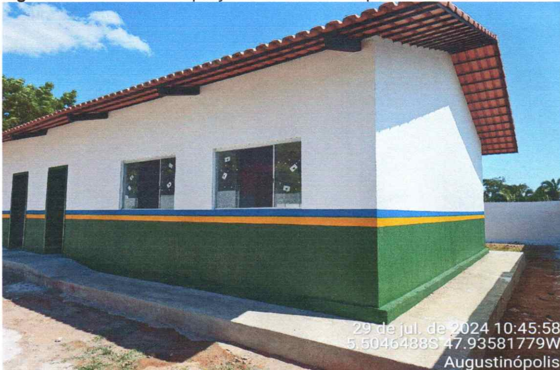
ÁREA EXTERNA COM TEXTURA E PINTURA FINALIZADOS