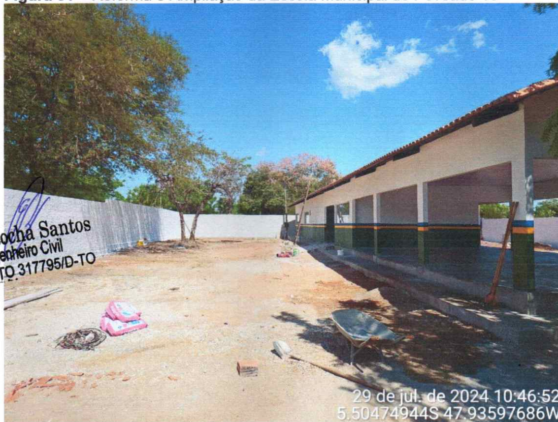
Figura 01 – Reforma e Ampliação da Escola Municipal do Povoado 16

ÁREA EXTERNA COM TEXTURA E PINTURA FINALIZADOS