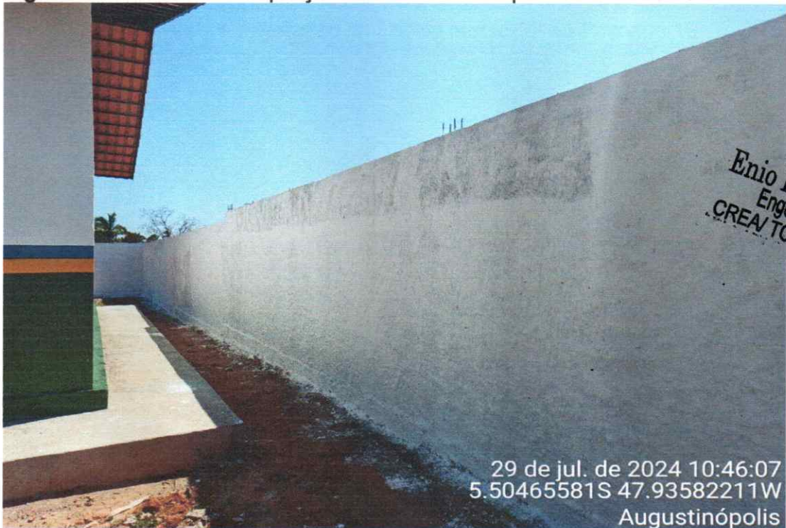
Figura 07 – Reforma e Ampliação da Escola Municipal do Povoado 16

Enio Rocha Santos Engenheiro Civil CREA/TO 317795/D-TO