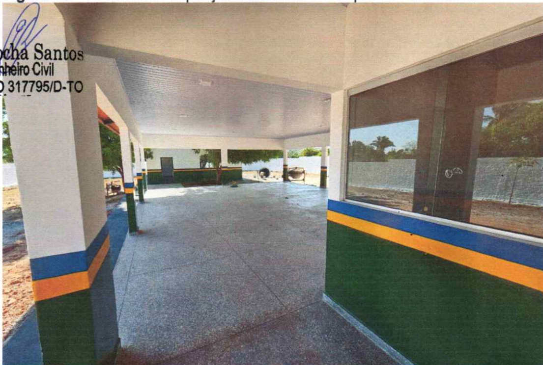
ÁREA INTERNA COM ACABAMENTOS FINALIZADOS