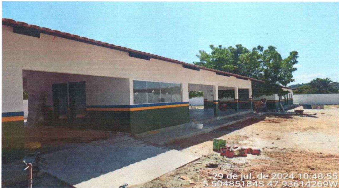
CALÇADA EM CONCRETO EXECUTADA LATERAL ESCOLA