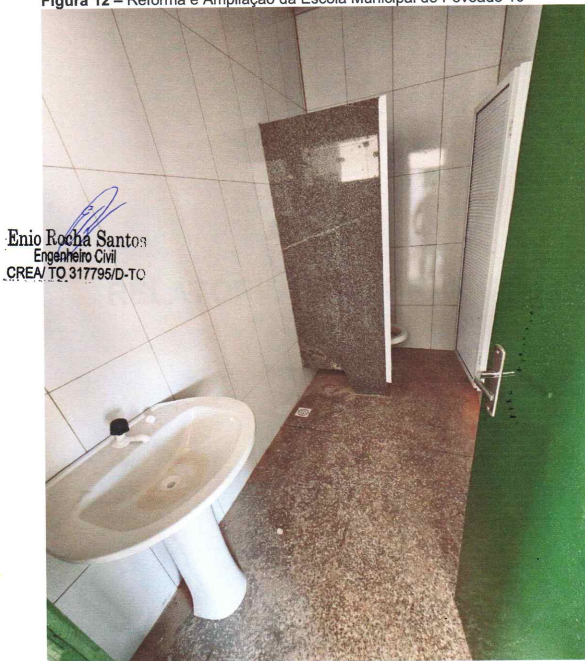
Figura 12 – Reforma e Ampliação da Escola Municipal do Povoado 16

ESTADO DO TOCANTINS PREFEITURA MUNICIPAL DE AUGUSTINÓPOLIS Rua Dom Pedro I, nº 352, Centro – Augustinópolis -TO