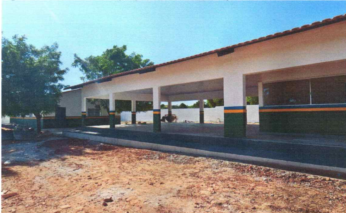
CALÇADA EM CONCRETO EXECUTADA LATERAL ESCOLA