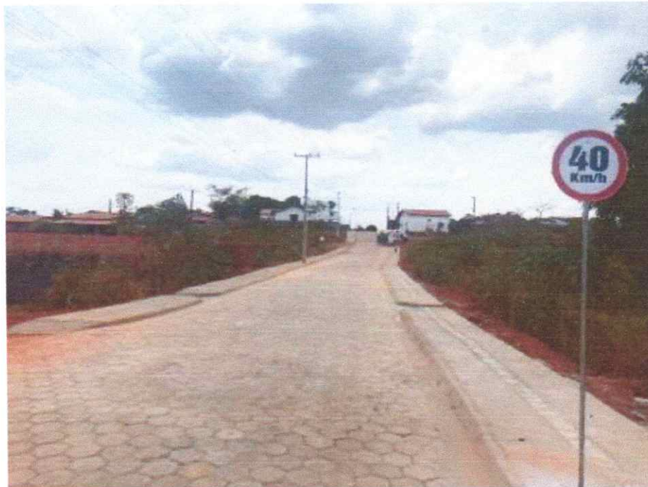
Meio fio, Sarjeta, Calçadas, Sinalização e Pavimentação em Bloquetes (Trecho III)

ESTADO DO TOCANTINS PREFEITURA MUNICIPAL DE AUGUSTINÓPOLIS Rua D. Pedro I n° 352 - Centro - CNPJ n° 00237206/0001-30