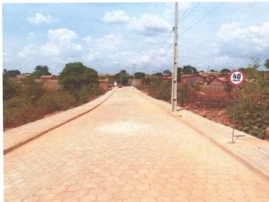
Meio fio, Sarjeta, Calçadas, Sinalização e Pavimentação em Bloquetes (Trecho III)