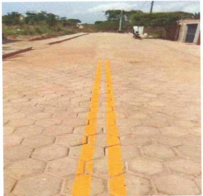
Meio fio, Sarjeta, Calçadas, Sinalização e Pavimentação em Bloquetes (Trecho I,II e III)