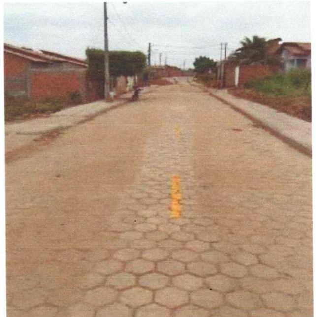
Meio fio, Sarjeta, Calçadas, Sinalização e Pavimentação em Bloquetes (Trecho I,II e III)