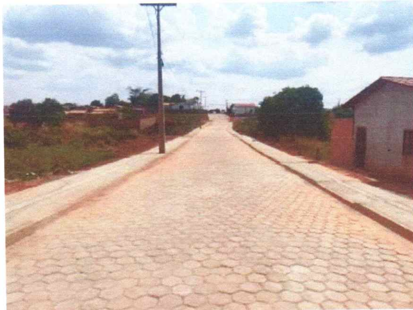
Meio fio, Sarjeta, Calçadas, Sinalização e Pavimentação em Bloquetes (Trecho III)

Este relatório fotográfico tem como objetivo relatar os serviços executados referente a (3ª Medição) da Implantação de Pavimento Intertravado e Drenagem de águas pluviais, localizado na Rua Maurício de Sousa Gomes; Jardim Primavera na Cidade de Augustinópolis /TO.