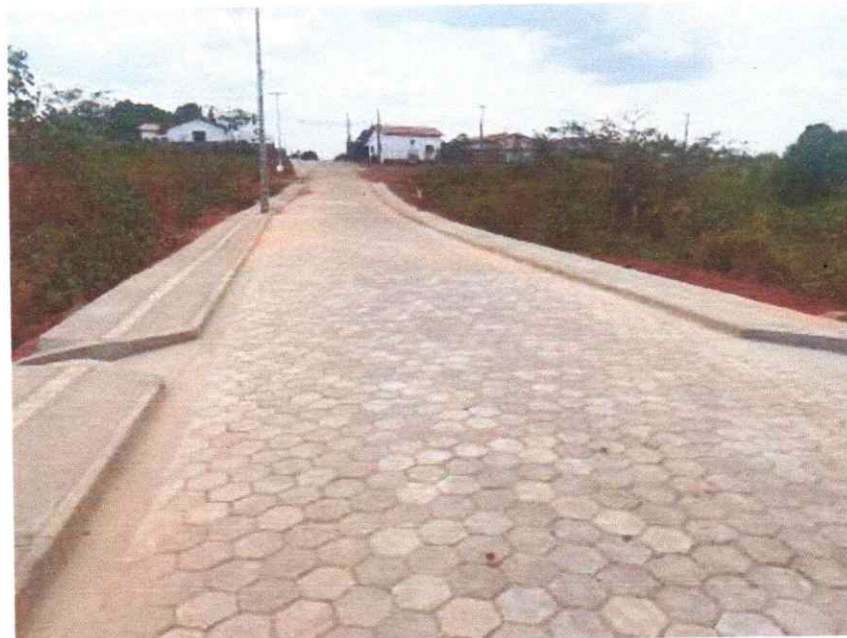
Meio fio, Sarjeta, Calçadas, Sinalização e Pavimentação em Bloquetes (Trecho III)