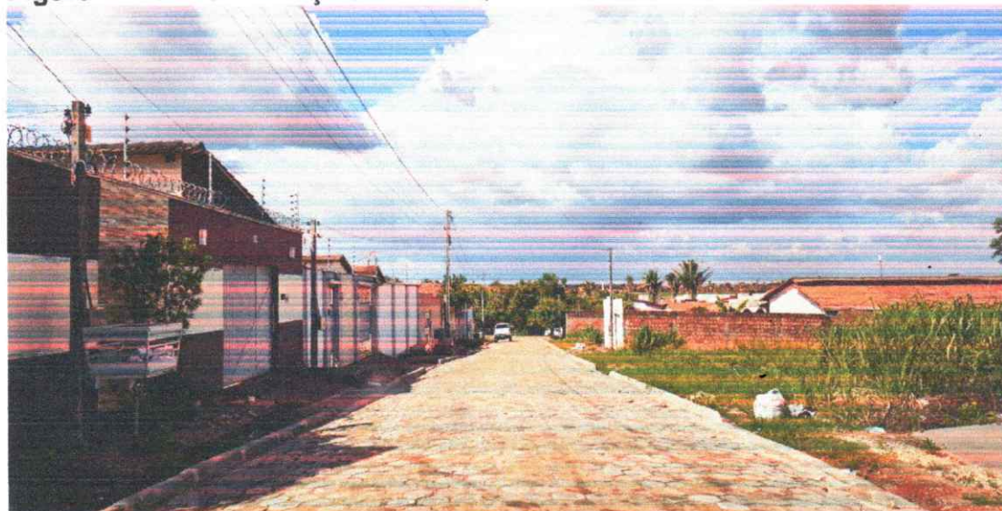
Figura 11 - PAVIMENTAÇÃO EM BLOQUETES BAIRO PORTAL DO SOL I

Execução de pavimento em piso intertravado com blocos sextavados 25x25cm Rua João Teodoro da Silva.