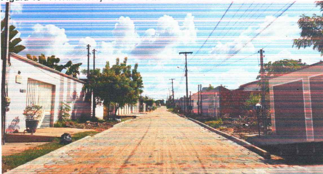
Figura 13 - PAVIMENTAÇÃO EM BLOQUETES BAIRO PORTAL DO SOL I

Execução de pavimento em piso intertravado com blocos sextavados 25x25cm Rua João Teodoro da Silva.