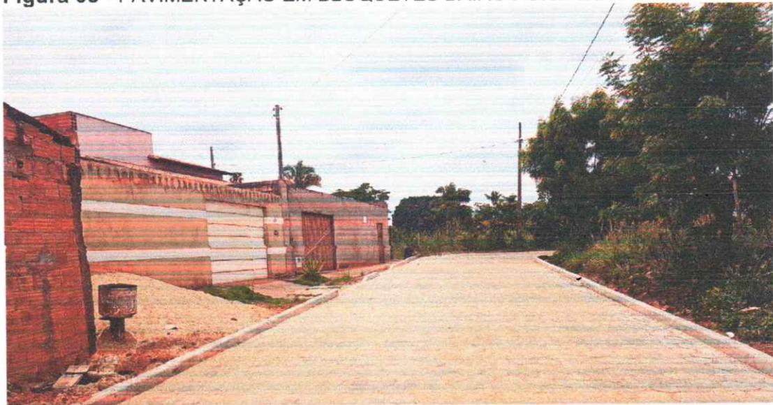
Figura 03 - PAVIMENTAÇÃO EM BLOQUETES BAIRRO PORTAL DO SOL I

Execução de pavimento em piso intertravado com blocos sextavados 25x25cm