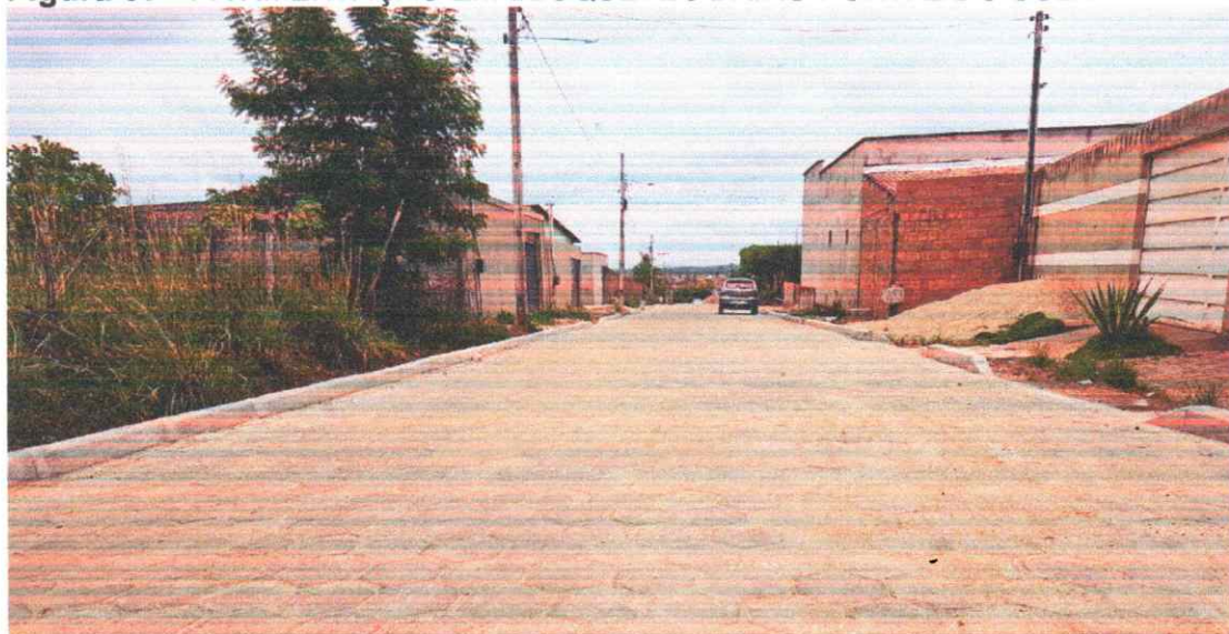
Figura 07 - PAVIMENTAÇÃO EM BLOQUETES BAIRRO PORTAL DO SOL I

Execução de pavimento em piso intertravado com blocos sextavados 25x25cm