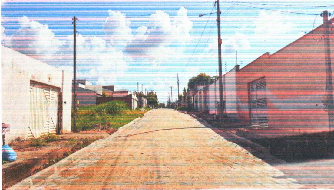
Figura 12 - PAVIMENTAÇÃO EM BLOQUETES BAIRO PORTAL DO SOL I

Execução de pavimento em piso intertravado com blocos sextavados 25x25cm Rua João Teodoro da Silva.