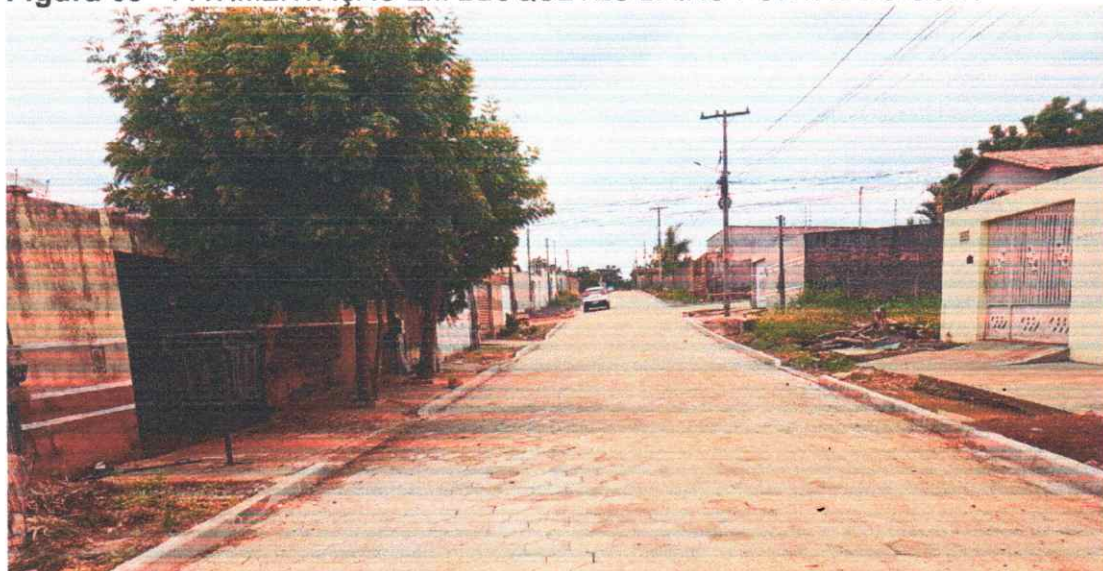
Figura 09 - PAVIMENTAÇÃO EM BLOQUETES BAIRO PORTAL DO SOL I

Execução de pavimento em piso intertravado com blocos sextavados 25x25cm. Rua João Teodoro da Silva.