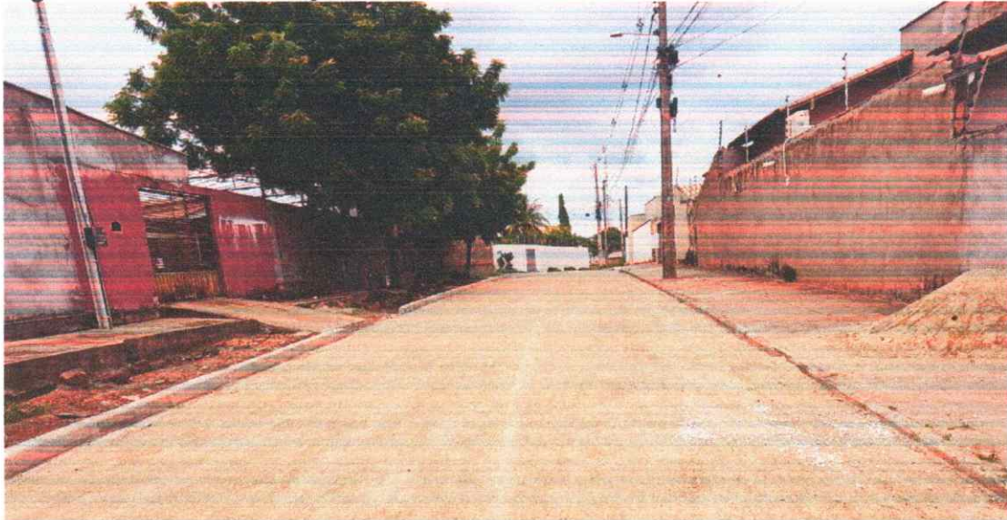
Figura 06 - PAVIMENTAÇÃO EM BLOQUETES BAIRRO PORTAL DO SOL I

Execução de pavimento em piso intertravado com blocos sextavados 25x25cm.