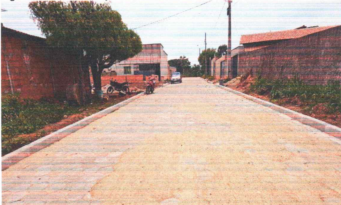
Figura 04 - PAVIMENTAÇÃO EM BLOQUETES BAIRRO PORTAL DO SOL I

Execução de pavimento em piso intertravado com blocos sextavados 25x25cm Rua João Teodoro da Silva.