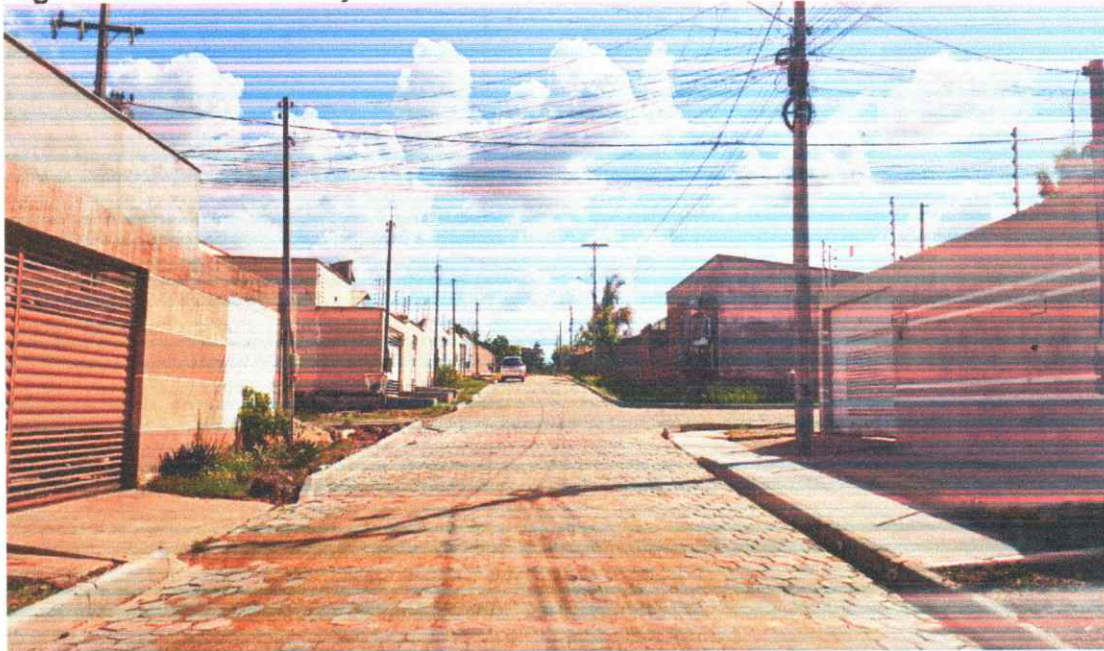
Figura 16 - PAVIMENTAÇÃO EM BLOQUETES BAIRRO PORTAL DO SOL I

Execução de pavimento em piso intertravado com blocos sextavados 25x25cm Rua João Teodoro da Silva.