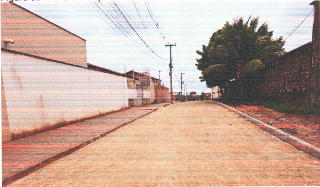
Figura 02 - PAVIMENTAÇÃO EM BLOQUETES BAIRRO PORTAL DO SOL I

Execução de pavimento em piso intertravado com blocos sextavados 25x25cm.