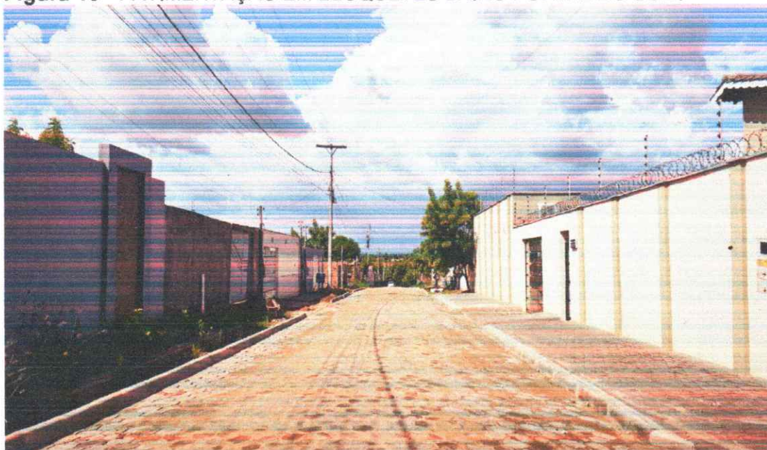
Figura 10 - PAVIMENTAÇÃO EM BLOQUETES BAIRO PORTAL DO SOL I

Execução de pavimento em piso intertravado com blocos sextavados 25x25cm Rua João Teodoro da Silva.