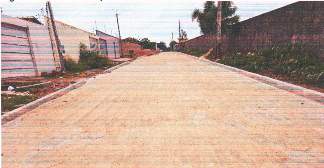
Figura 08 - PAVIMENTAÇÃO EM BLOQUETES BAIRO PORTAL DO SOL I

Execução de pavimento em piso intertravado com blocos sextavados 25x25cm. Rua João Teodoro da Silva.