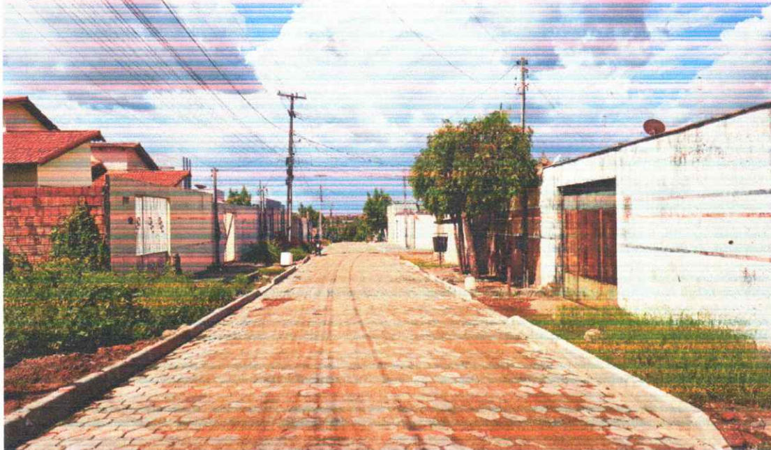
Figura 14 - PAVIMENTAÇÃO EM BLOQUETES BAIRRO PORTAL DO SOL I

Execução de pavimento em piso intertravado com blocos sextavados 25x25cm Rua João Teodoro da Silva.