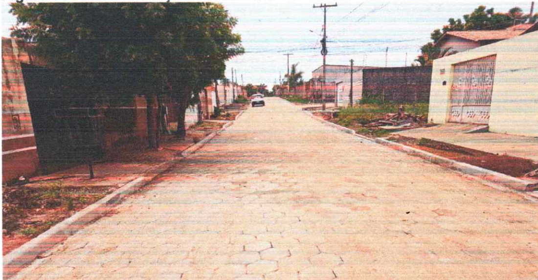
Figura 05 - PAVIMENTAÇÃO EM BLOQUETES BAIRRO PORTAL DO SOL I

Execução de pavimento em piso intertravado com blocos sextavados 25x25cm.