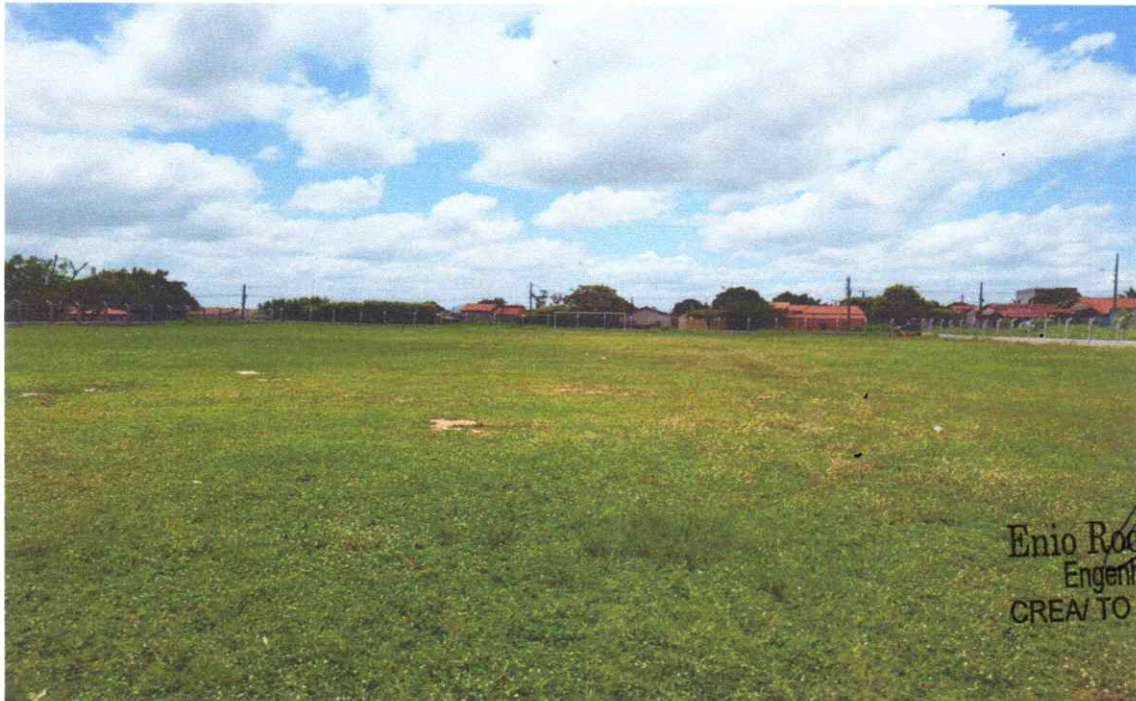
Figura 05 – REFORMA CAMPO FUTEBOL SÃO PEDRO, COM INSTALAÇÃO DE ALAMBRADO

Estaca broca de concreto, armação de pilar, alvenaria de vedação e tela em arame galvanizado.