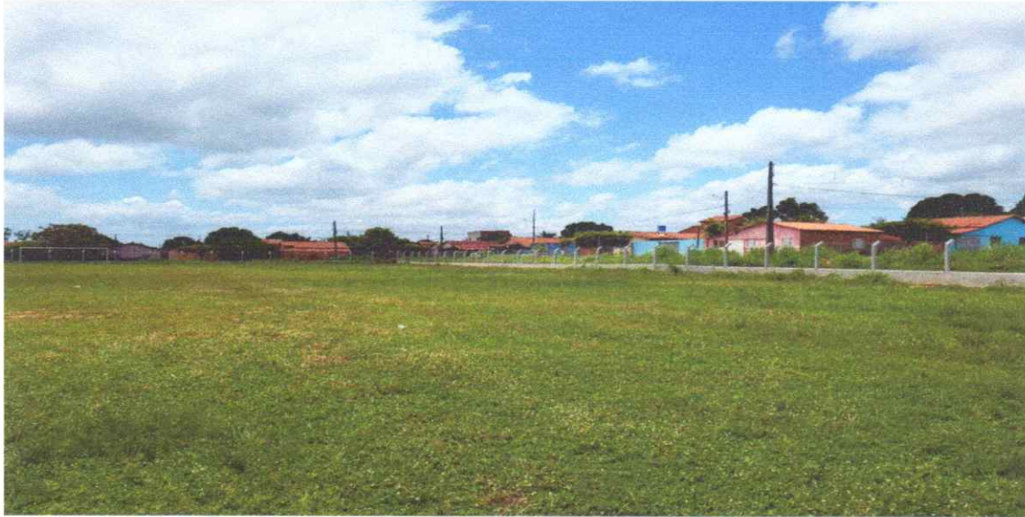
Figura 04 – REFORMA CAMPO FUTEBOL SÃO PEDRO, COM INSTALAÇÃO DE ALAMBRADO

Estaca broca de concreto, armação de pilar, alvenaria de vedação e tela em arame galvanizado.