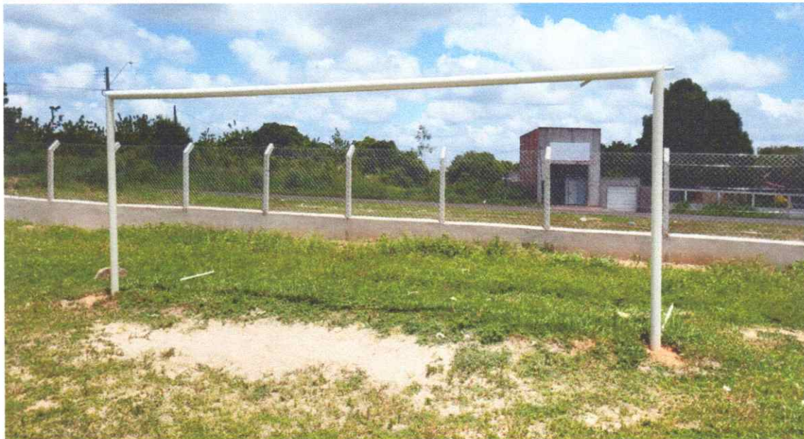
Figura 10 – REFORMA CAMPO FUTEBOL SÃO PEDRO, COM INSTALAÇÃO DE ALAMBRADO

Trave de gol em tubo galvanizado com pintura com tinta alquídica de fundo.