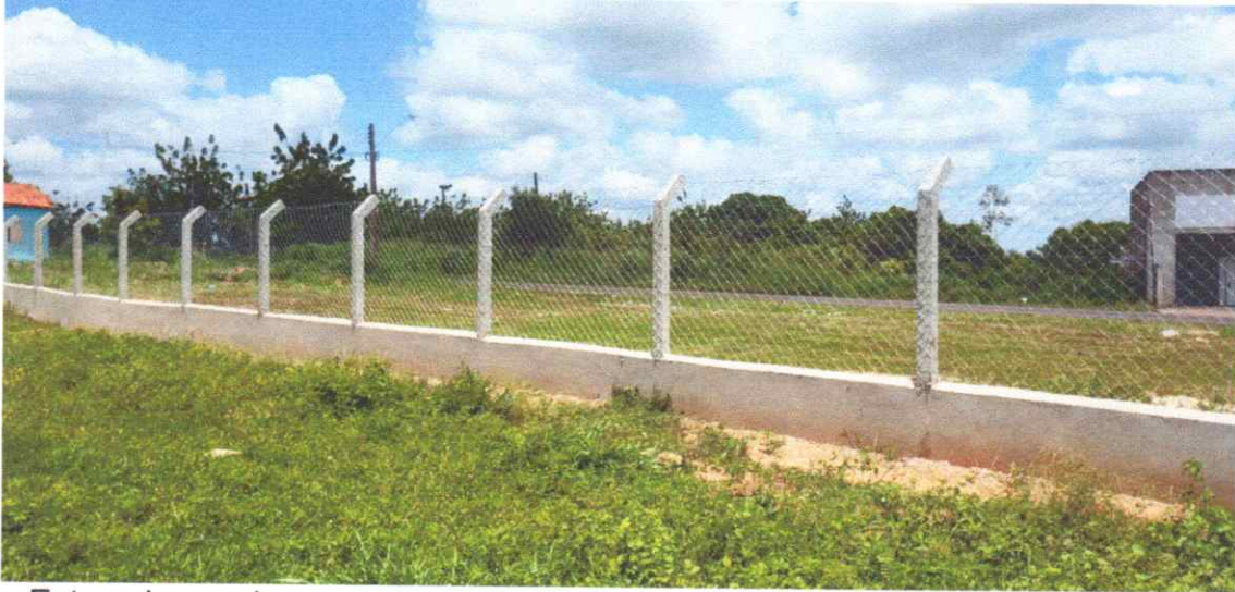
Figura 12 – REFORMA CAMPO FUTEBOL SÃO PEDRO, COM INSTALAÇÃO DE ALAMBRADO

Estaca broca de concreto, armação de pilar, alvenaria de vedação e tela em arame galvanizado.