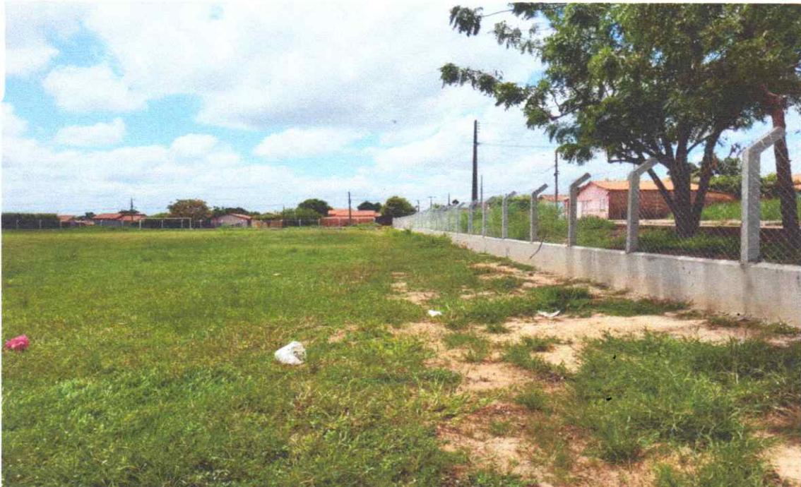
Figura 03 – REFORMA CAMPO FUTEBOL SÃO PEDRO, COM INSTALAÇÃO DE ALAMBRADO

Estaca broca de concreto, armação de pilar, alvenaria de vedação e tela em arame galvanizado.