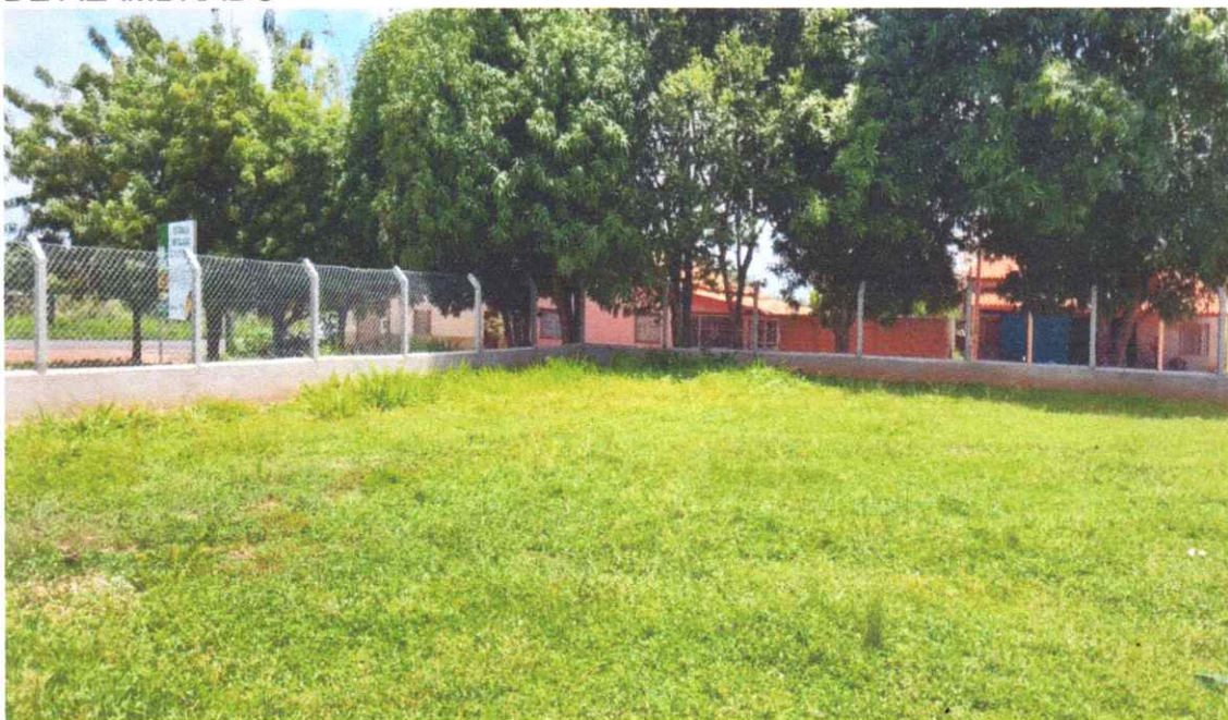
Figura 01 – REFORMA CAMPO FUTEBOL SÃO PEDRO, COM INSTALAÇÃO DE ALAMBRADO

Estaca broca de concreto, armação de pilar, alvenaria de vedação e tela em arame galvanizado.