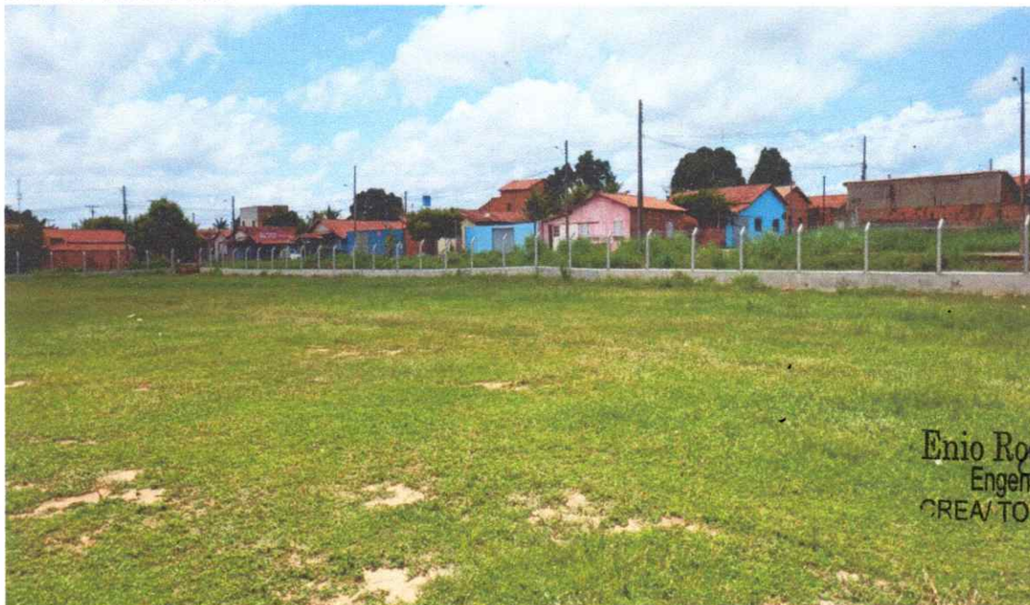
Figura 09 – REFORMA CAMPO FUTEBOL SÃO PEDRO, COM INSTALAÇÃO DE ALAMBRADO

Estaca broca de concreto, armação de pilar, alvenaria de vedação e tela em arame galvanizado.