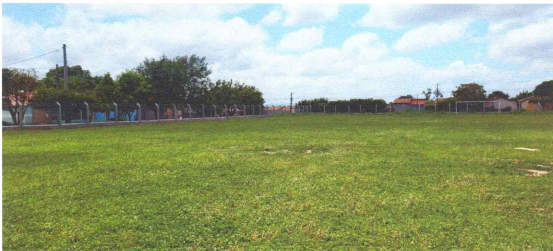
Figura 08 – REFORMA CAMPO FUTEBOL SÃO PEDRO, COM INSTALAÇÃO DE ALAMBRADO

Estaca broca de concreto, armação de pilar, alvenaria de vedação e tela em arame galvanizado.