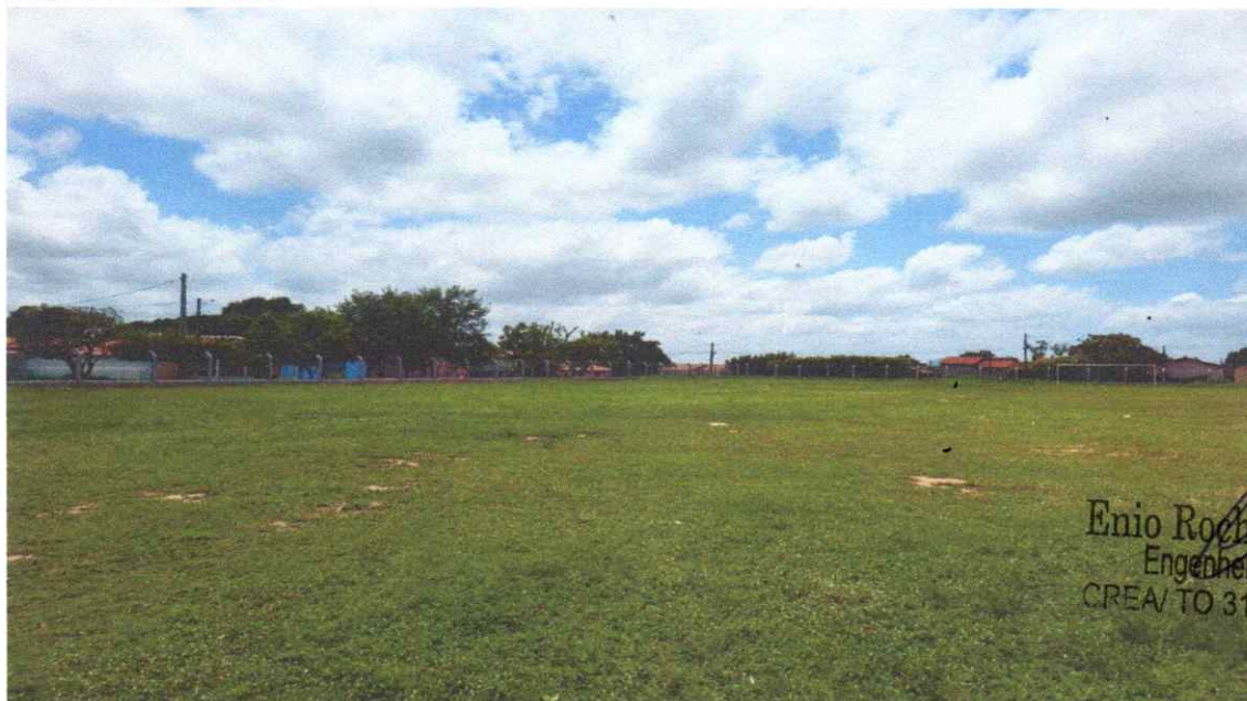
Figura 07 – REFORMA CAMPO FUTEBOL SÃO PEDRO, COM INSTALAÇÃO DE ALAMBRADO

Enio Rocha Santos Engenheiro Civil CREA/TO 317795/D-TO