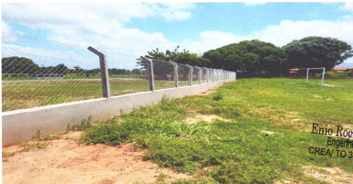
Figura 11 – REFORMA CAMPO FUTEBOL SÃO PEDRO, COM INSTALAÇÃO DE ALAMBRADO

Estaca broca de concreto, armação de pilar, alvenaria de vedação e tela em arame galvanizado.