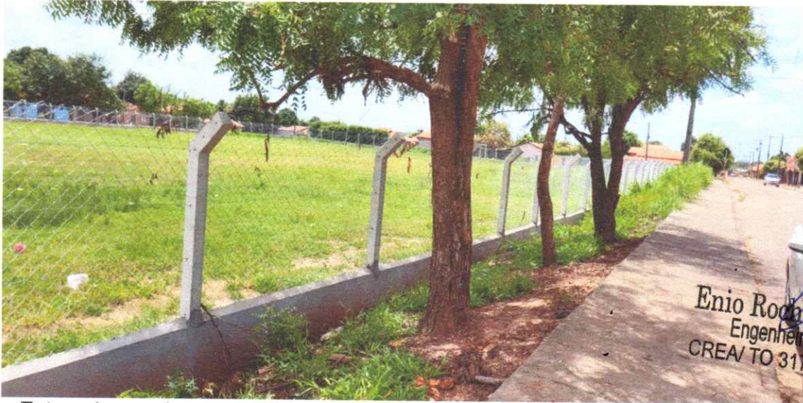
Figura 13 – REFORMA CAMPO FUTEBOL SÃO PEDRO, COM INSTALAÇÃO DE ALAMBRADO

Estaca broca de concreto, armação de pilar, alvenaria de vedação e tela em arame galvanizado.