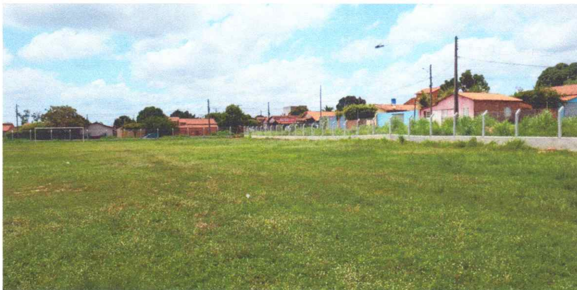
Figura 06 – REFORMA CAMPO FUTEBOL SÃO PEDRO, COM INSTALAÇÃO DE ALAMBRADO

Estaca broca de concreto, armação de pilar, alvenaria de vedação e tela em arame galvanizado.