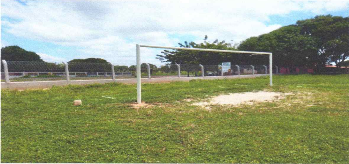
Figura 02 – REFORMA CAMPO FUTEBOL SÃO PEDRO, COM INSTALAÇÃO DE ALAMBRADO

Trave de gol em tubo galvanizado com pintura com tinta alquídica de fundo.